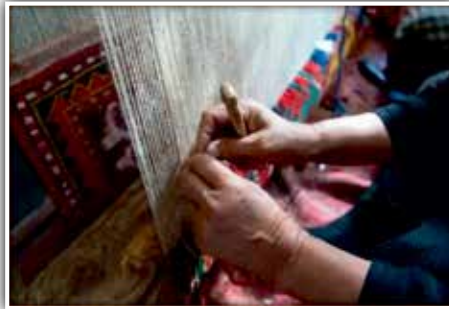
डॉ शशि बाला