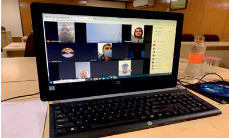
क्षेत्र अन्वेषकों के साथ एक ऑनलाइन बैठक