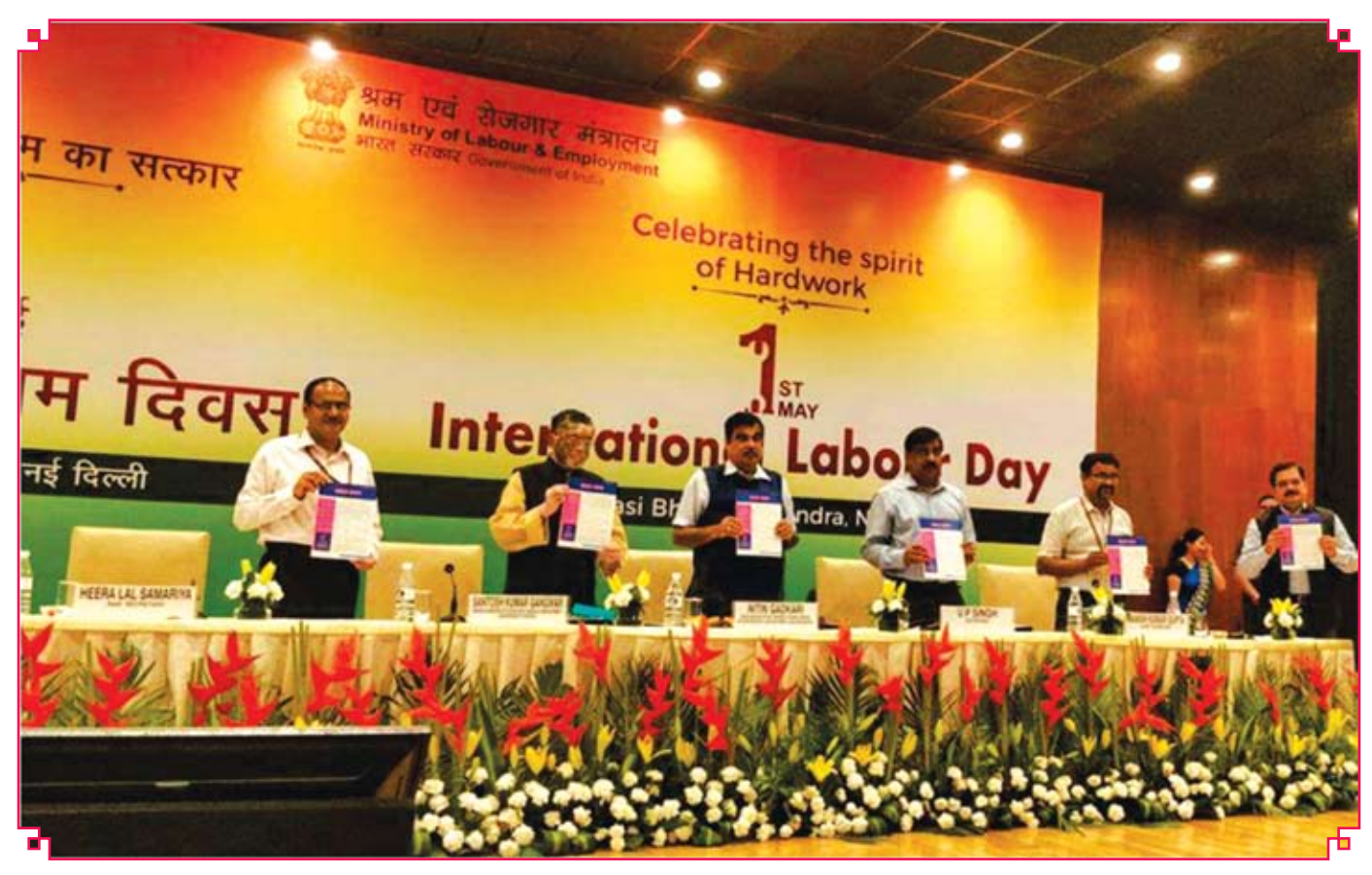
Release of January to March 2018 issue of "CHILD HOPE" on 1st May 2018

Volume 7 No. 1 January to March issue of the Newsletter "Child Hope" was released by Shri Nitin Gadkari, Minister of Road Transport and Highways, and Shri Santosh Kumar Gangwar, Hon'ble Minister of State for Labour & Employment (Independent Charge) during the International Labour Day celebrations. This event was organized by the Ministry of Labour & Employment, Government of India, on 1st May 2018 at Pravasi Bharatiya Kendra, New Delhi. During the release of this issue of Newsletter the dignitaries, delegates and the participants were informed that the "Child Hope" is a quarterly Newsletter is an initiative of the Ministry of Labour & Employment and is published by its autonomous body the V. V. Giri National Labour Institute. It was