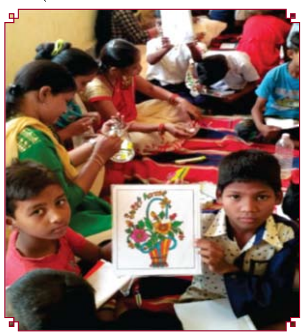
10 दिवसीय ग्रीष्मकालीन प्रशिक्षण शिविर का आयोजन दिनांक 21 से 31 मई 2018 तक किया गया।

बच्चे के माता—पिता द्वारा सकारात्मक रवैया अपनाये जाकर, बच्चे को राष्ट्रीय बालश्रम परियोजनार्न्तगत संचालित विशेष प्रशिक्षण केन्द्र में दर्ज कराया गया। वर्तमान में बच्चा कक्षा आठवीं में अन्यत्र स्थानीयशाला में नियमित रूप से अध्ययनरत् है।