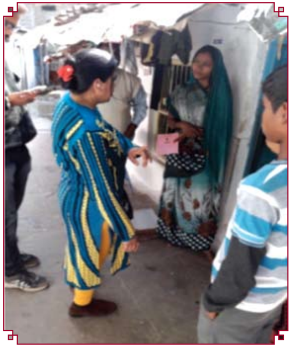
टीम द्वारा बच्चे के माता-पिता से चर्चा कर पूरे परिवार को समुचित परामर्श प्रदान किया गया।

पेंसिल पोर्टल पर प्राप्त शिकायत के संदर्भ में जांच पर शिकायत सही पाई गई, परिणामस्वरूप बच्चे को कार्य से पृथक किया गया।