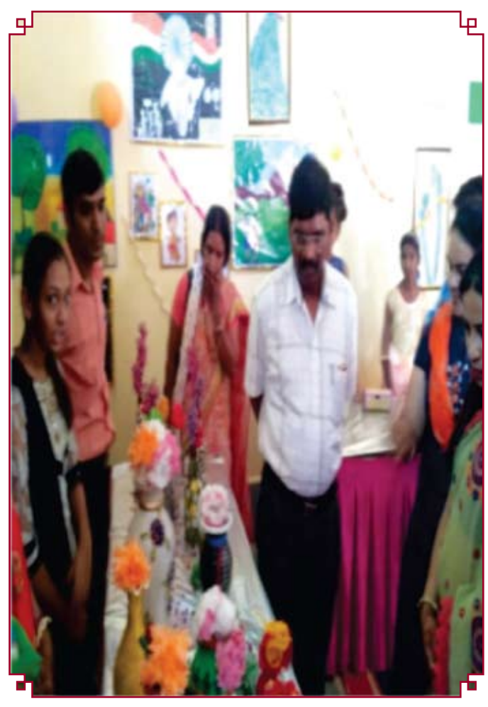
प्रदशर्नी का अवलोकन करते हुए संभाग जबलपुर के सहायक श्रमायुक्त महोदय