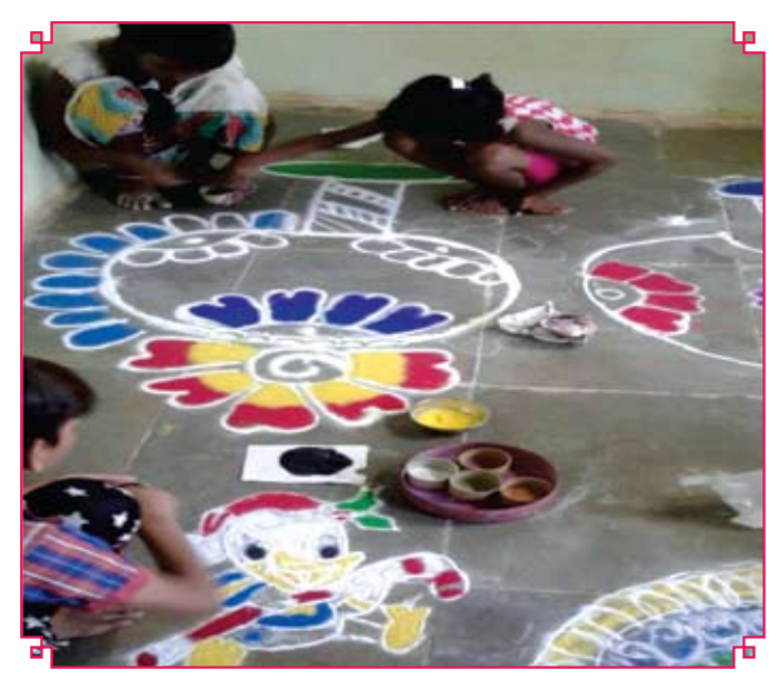
jkVh cly Je ifj; ktukthyuk fo'kkif kkkdszes0 ol k d if kkkyssgy Nk