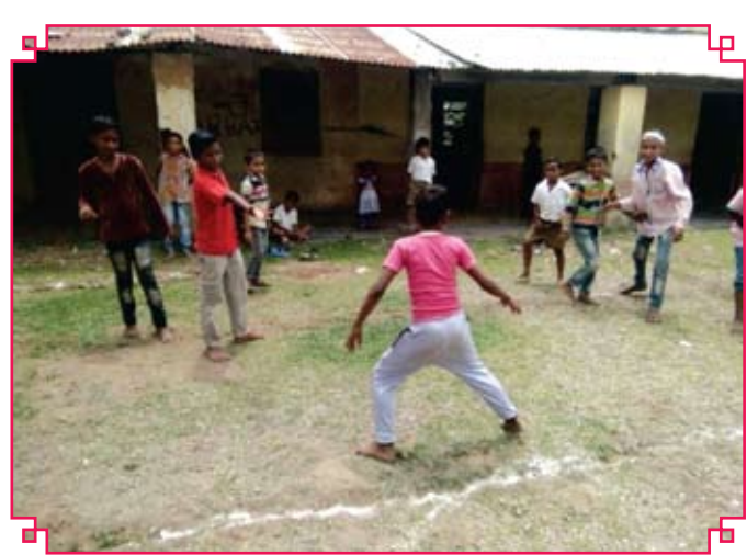
jkVh, chy Je ifj; ktukthyult fo'likif kkkdly dazea blyfuk dsek; e 1 sf klkyssgy Nk