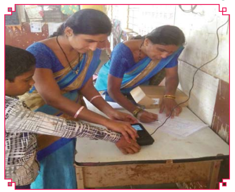
fo'likif Kkkdameslo; å shf Kldlavlj Nk-ladhnifillfr i thr djusdsfy, clylefyd e'lhladkni; k l llhfo'likif Kkkdamesfd; ktlrkgA