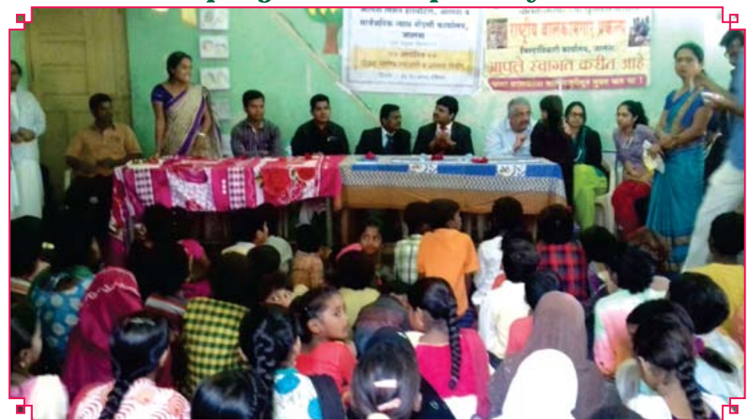
p g Vhdfe'kij] fe'ku vLirky tkyuk, ul hyihde p ljhv lj i zk 1 r Nk