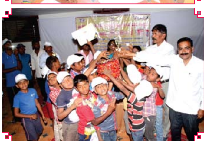
NCLP, Tiruchirapalli District, (Tamil Nadu)