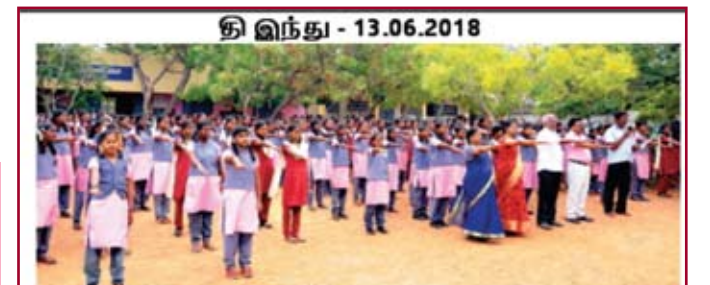
அரசு பெண்கள் மேல்நிலைப் பல்ளியில், அழுதைகள் உரிகமக்கான நேரநலை கட்டமைப்பு ஊர்வில் நேற்று நடந்து நின்மாரி அநிர்பு நலக் வீதிப்புகள் நடந்துக்கியில் மணைகிகள் மற்றும் ஆசிரிபர்கள், டெற்றோர் ஆசிரிபர் அதிலோநி வநித்துக்கொண்டனர். இந்திவுக்கியில், நிறு அறக்கட்டணை இவந்து நிரமக்கத்திரன், ஒரிவண் இபர் உழுவனர் வரி உள்ளிடப்பர் நடந்துகொண்டார்கள்

என்பதால் H வயதுக்கு கட்பட்ட குழந்தைகளை ஒருபோதும் பணியில் ஈடுப டுத்த மாட்டோம், குழந்தை தொழிமானர்கள் முறதா முற்றீலும் அகற்ற சமுதா மத்தில் விறிப்புணம் வு ஏற்படுத்த பாடுபடுவேன் என கறுடுமொழி எடுத்து கொண்டனர்.